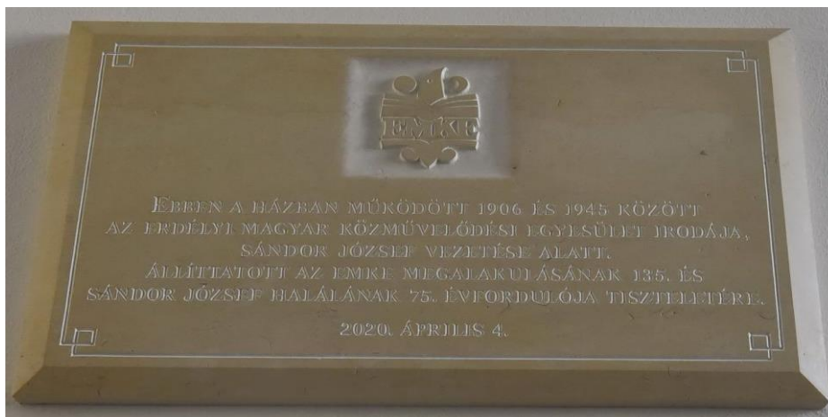
Az emléktábla.